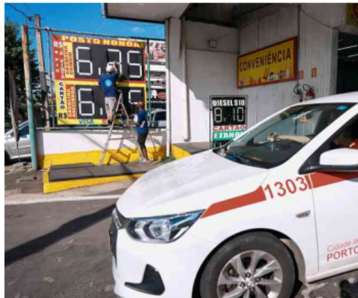
Funcionários atualizam preços de combustíveis em banners de posto em Porto Alegre (RS) Diego Vara - 20.mar.26/Reuters

Dados da ANP (Agência Nacional do Petróleo, Gás e Biocombustíveis) indicam que, desde o início do confronto no Irã, os preços médios da gasolina comum e do diesel S-10 aumentaram 8% e 24% no Brasil, refletindo repasses promovidos principalmente por importadores privados. A Petrobras subiu o valor do diesel em suas refinarias, mas a alta foi arrefecida pela isenção de